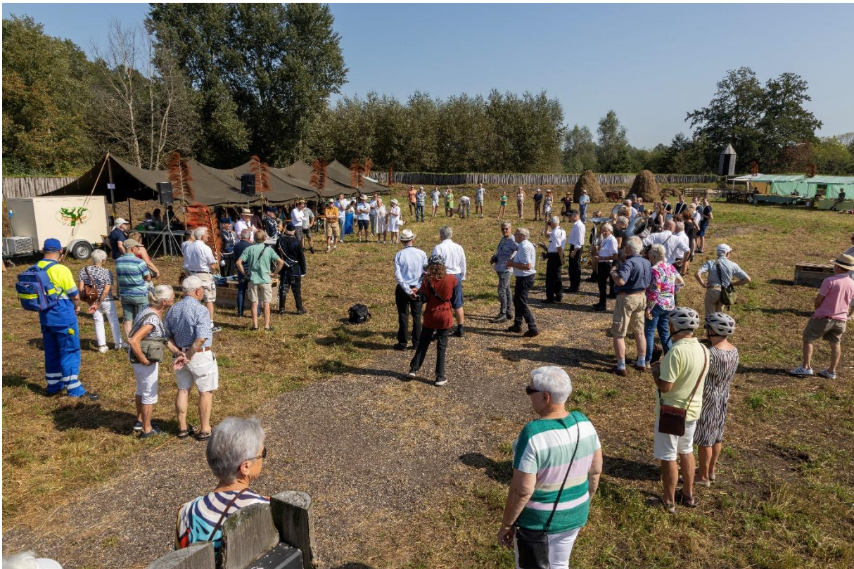
Open Monumenten Dag 2023

De Loobeek is de afgelopen jaren door Waterschap Limburg heringericht van een gekanaliseerde beek naar een meanderende met ruime natuur er om heen. De ontwikkelingen in de bovenloop zijn een uitdaging om op een vernieuwende manier de vitaliteit van het gebied te stimuleren. De stichting doet dat door unieke projecten te realiseren die de historie en de natuur toeristisch aantrekkelijk maken voor bezoekers van de streek. In de visie van Stichting Loobeek gebeurt dat door mensen te verbinden: onderling, met de natuur en het verleden.